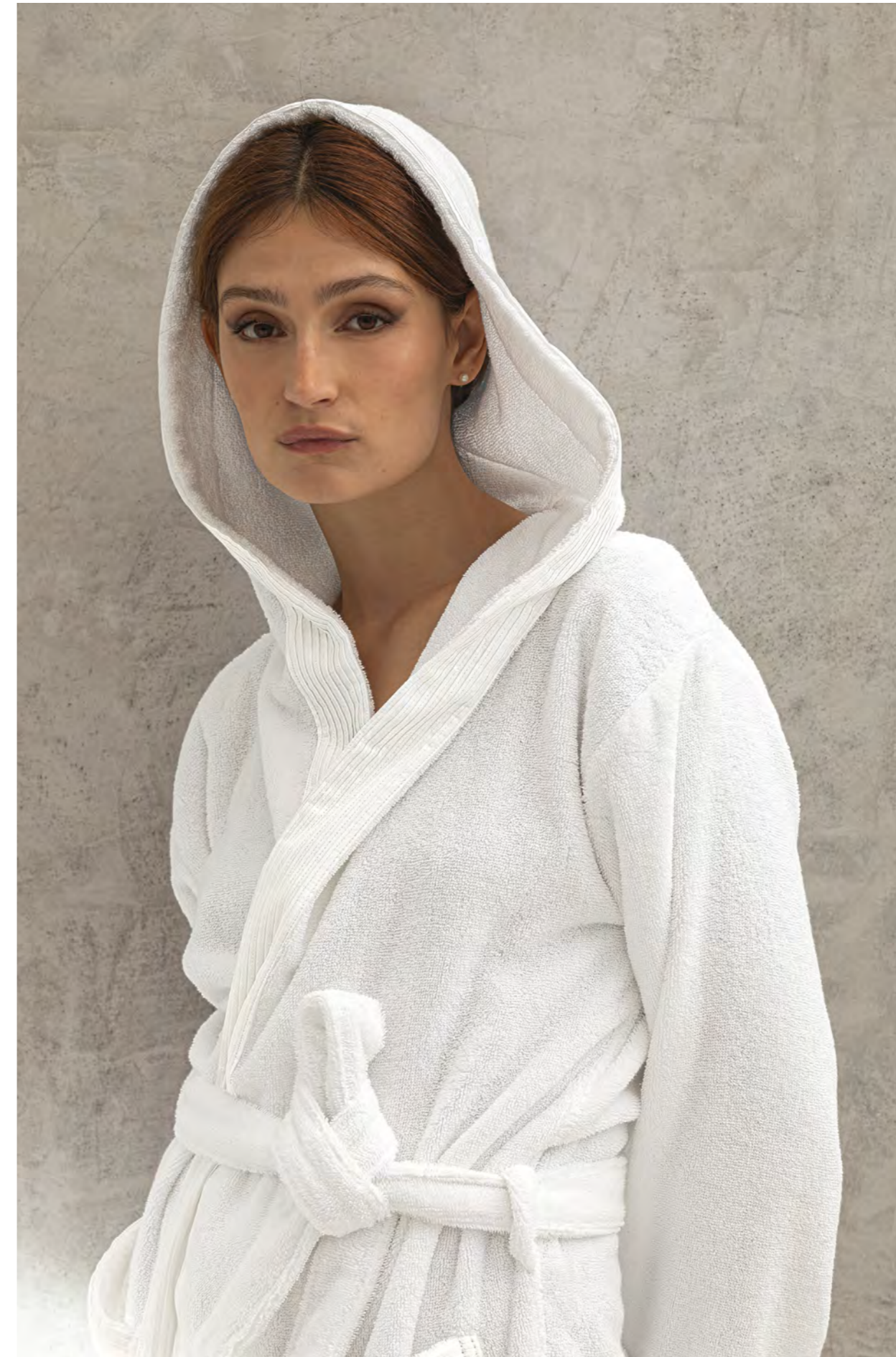
ASCIUGAMANI E ACCAPPATOIO ODEON.