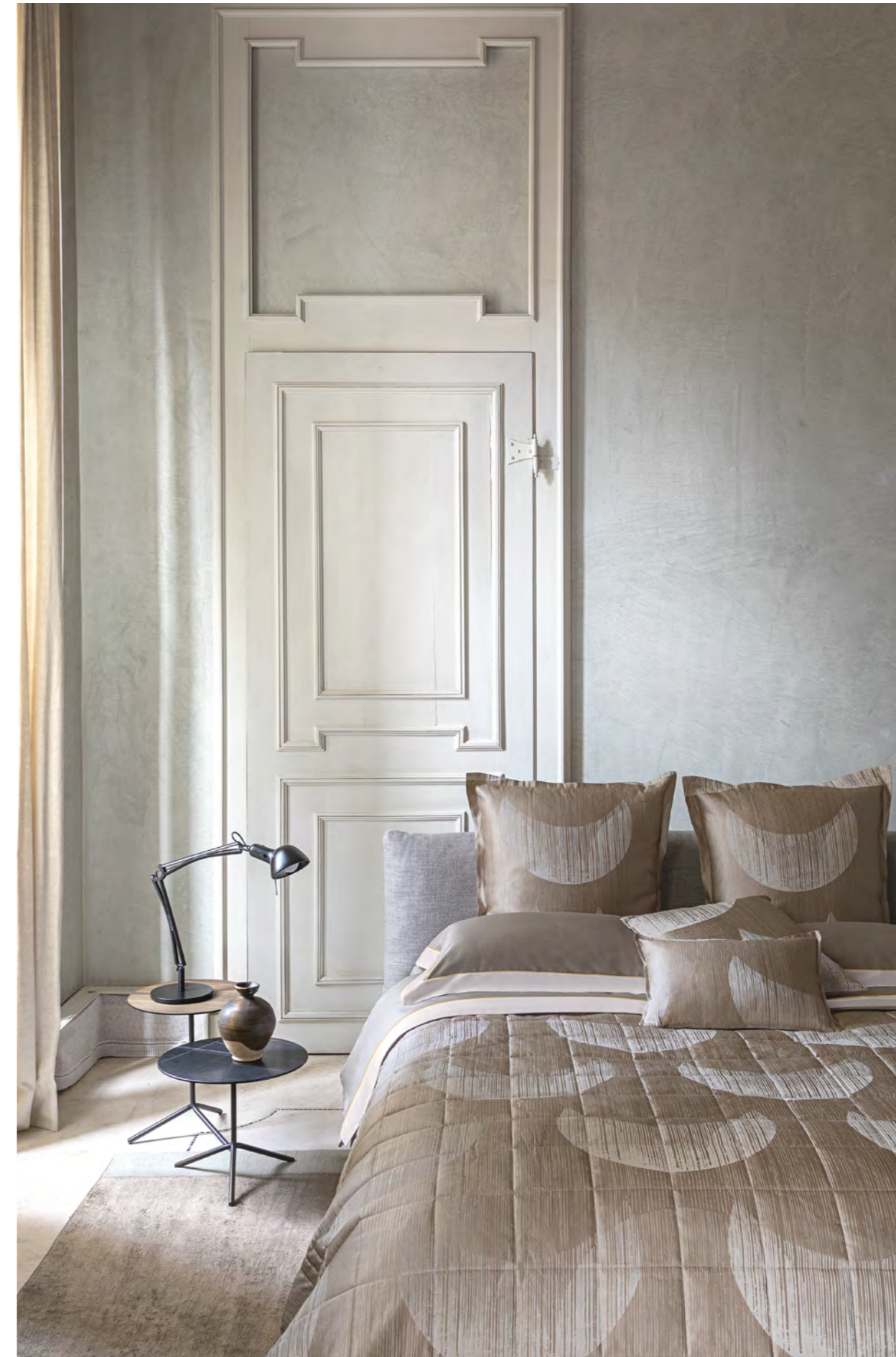
COMPLETO LENZUOLA QUADRILATERO; FEDERE 65X65, CUSCINI E QUILT PIAZZA MEDA.